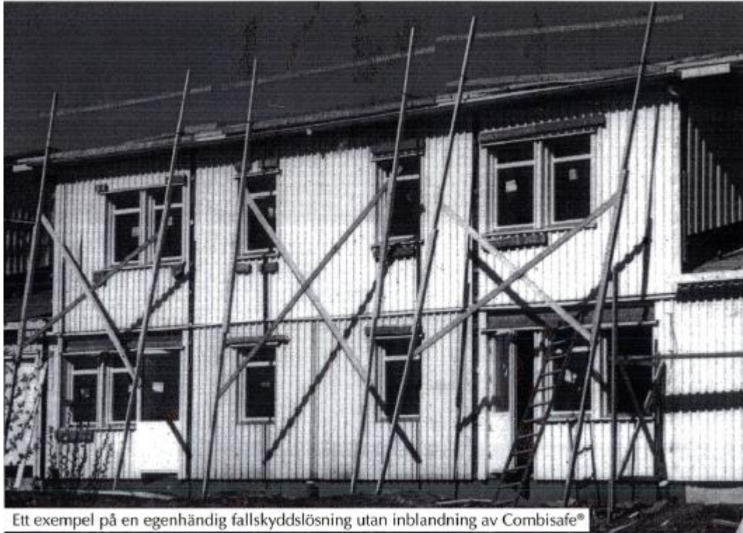
Ett exempel på en egenhändig fallskyddslösning utan inblandning av Combisafe®

Dette bildet viser den typen kantsikring som Lars-Anders Reinklou ønsket å bytte ut. På fritiden og med god hjelp fra familie og venner arbeidet han med ideene sine, og dermed ble det første av produktene som en dag skulle bli kjent som COMBISAFES kantsikring skapt.